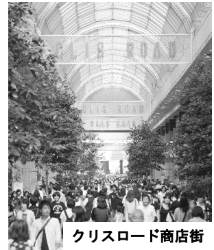
クリスロード商店街

そのうえで、クリスロード商店街に関する事柄のうち、あなた自身が興味を持った事柄 (例えば、関係する人や団体・企業、社会的制度、歴史的出来事、イベント等の取り組み、建物や空間構成、その他クリスロード商店街に関連するものごと等) を三つ挙げ、それぞれ興味を持った理由や自分なりの仮説等を、以下に記述してください。